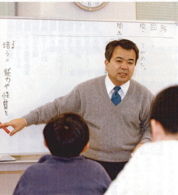
入試が近づき、四谷大塚市ヶ谷校舎では、講師も指導に熱が入る。講師陣の質も塾選びの重要なポイントだ

京都では洛星や洛南に強い「成基学園」、奈良では東大寺学園や西大和学園に強い「稲田塾」や「市田塾」など、地元密着の塾が支持されている。もちろん、それ以外にも、有名中学校がある地域では、塾が林立し、競争も激しい。北海道は「北大学力増進会」や「練成会」、愛知は「河合塾」「佐鳴予備校」「名進研」、福岡は「英進館」「全教研」が人気のようだ。ところで、高校受験になると、人気上位塾の顔ぶれも変わってくる。東京の1位は「早稲田アカデミー」、2位は「市進学院」。いずれも、本来、高校受験から出発しているだけに、支持も根強い。そのほか、神奈川1位の「STEP(ステップ)」、大阪2位の「友だちが行っているから行く」は要注意。②「看板」に惑わされない ③必ず授業を見学する ④合格実績の中身を確かめる ⑤教材や授業進度を調べるの5点を挙げ、「友だちに合わせても、わが子に合うとは限りません。また、合格実績がよいと評判でも、塾